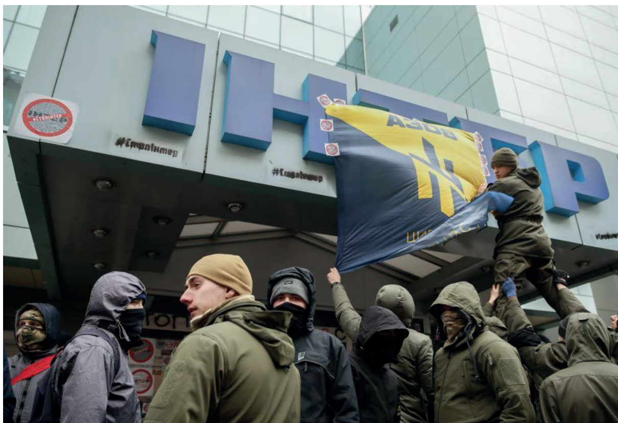
Боевики запрещенного в РФ «Азова» блокируют телеканал «Интер»

Европейского союза 23 , однако обещанного ранее закрытия сайта не произошло — после небольшой паузы в 2016 году он восстановил свою работу.