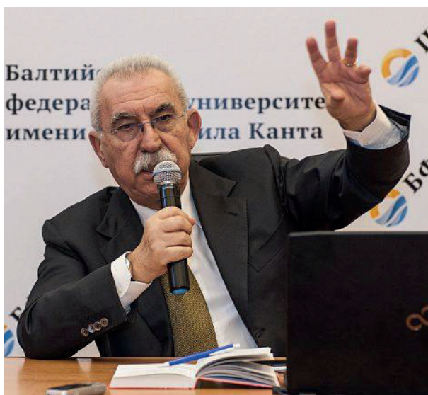
Джульетто Кьеза

ция безопасности и объявила о его выдворении из Латвии 10 .