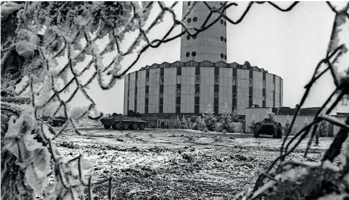
У здания телебашни в Вильнюсе, 1991 год

Карательная машина включается при необходимости защитить и другие краеугольные для прибалтийского мифа сюжеты. Например, сюжет «сталинских депортаций» — принудительных переселений жителей Эстонии, Латвии и Литвы в Сибирь в 1941 и 1949 годах. Прибалтийские государства называют депортации геноцидом, ставят знак равенства между ними и Холокостом и используют их для доказательства того, что Советский Союз и Третий рейх были равно преступными тоталитарными режимами, а советский период в истории Прибалтики был «жесточкой бесчеловечной оккупацией». Поэтому они жестко реагируют на критику в свой адрес и указания на некорректность сравнения массового переселения с Холокостом.