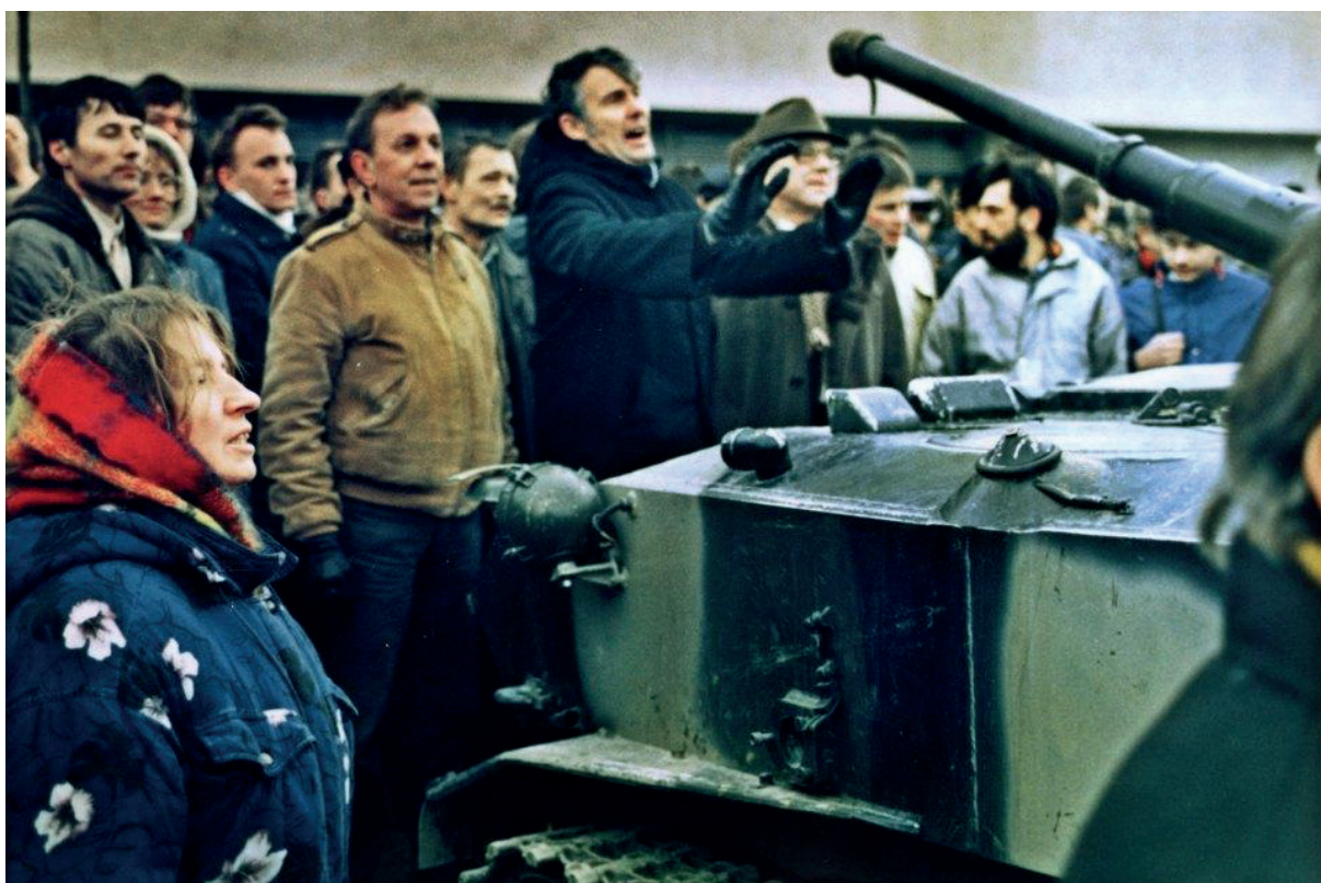
Протестующие блокируют советский танк у Дома печати в Вильнюсе

телебашни погибли 13 человек. Официально утвержденная в Литве версия тех событий гласит, что в гибели этих людей повинны советские военные, которые пытались штурмом взять телецентр, стреляли в его защитников и давили их танками. При этом в стране четверть века отвергаются свидетельства очевидцев событий, утверждающих, что советские военные не открывали огонь по толпе, а в защитников телецентра стреляли снайперы с крыш.