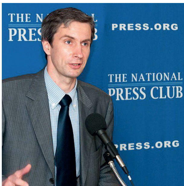
Альгирдас Палецкис / Фото: noelstjohn.com

ПБК выпустил репортаж программы «Человек и закон», в котором приводились показания свидетелей, видевших снайперов на крышах зданий у телецентра, а также слова экс-командующего боевыми отрядами «Саюдиса» Аудрюса Буткявичюса, признавшегося, что в толпу защитников телебашни стреляли его подчиненные, а решение устроить провокацию и выставить СССР на весь мир кровавым агрессором принял первый глава восстановленного Литовского государства Витаутас Ландсбергис 4 .