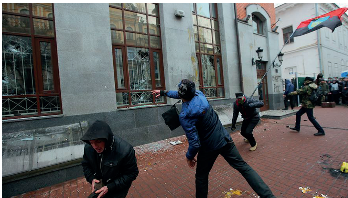
Радикалы громят офис Россотрудничества в Киеве

нальный совет по вопросам теле- и радиовещания Украины раскритиковал анонсированный заранее «Интером» видеофрагмент, опубликовав на сайте заявление, что он направлен на раскол общества и является очередной атакой в информационной войне. Чтобы не допустить трансляции концерта, ультраправые группировки блокировали здание телекомпании и попытались поджечь его 30 . Арлем Дезир, представитель ОБСЕ по СМИ, осудил эти действия и призвал власти Украины гарантировать журналистам безопасную для работы среду.