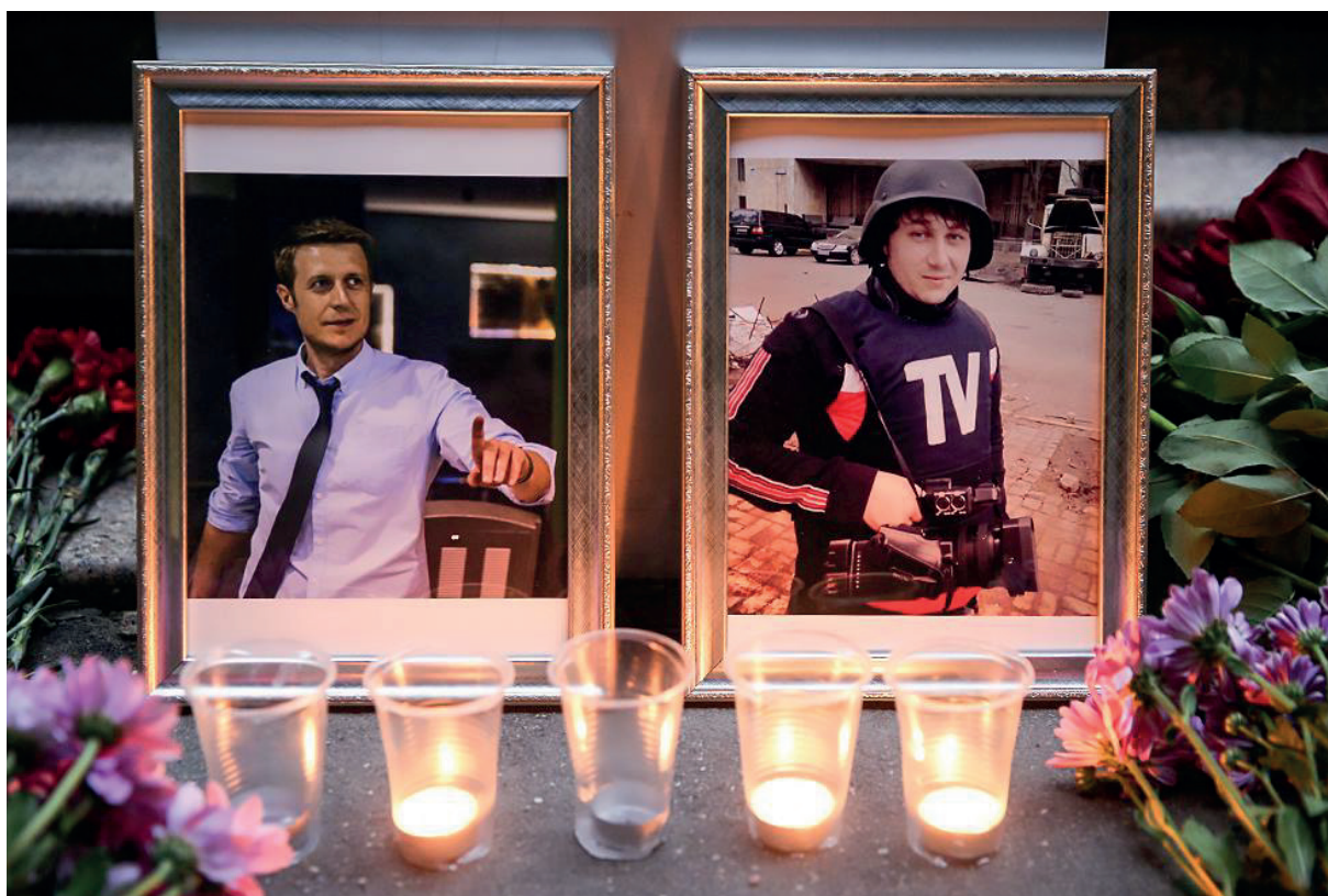
Цветы и свечи в память о погибших журналистах Игоре Корнелюке и Антоне Волошине

от Рокелли, за жертв авианалета в странах Евросоюза вступить было некому.