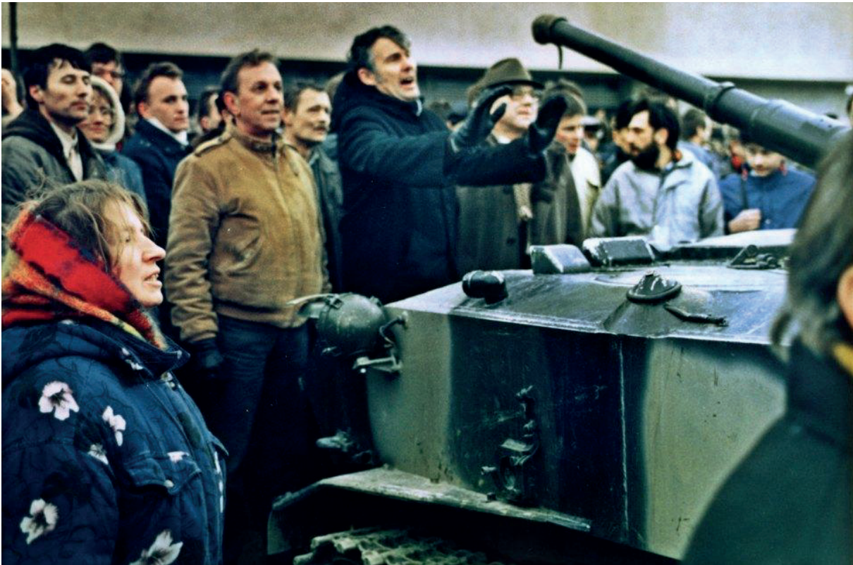
Протестующие блокируют советский танк у Дома печати в Вильнюсе

телебашни погибли 13 человек. Официально утвержденная в Литве версия тех событий гласит, что в гибели этих людей повинны советские военные, которые пытались штурмом взять телецентр, стреляли в его защитников и давили их танками. При этом в стране четверть века отвергаются свидетельства очевидцев событий, утверждающих, что советские военные не открывали огонь по толпе, а в защитников телецентра стреляли снайперы с крыш.