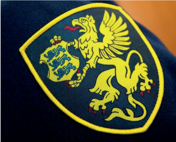
Эмблема эстонской КаПо / Фото: Andres Putting

на негосударственных языках: на русском, а в Литве также на польском.