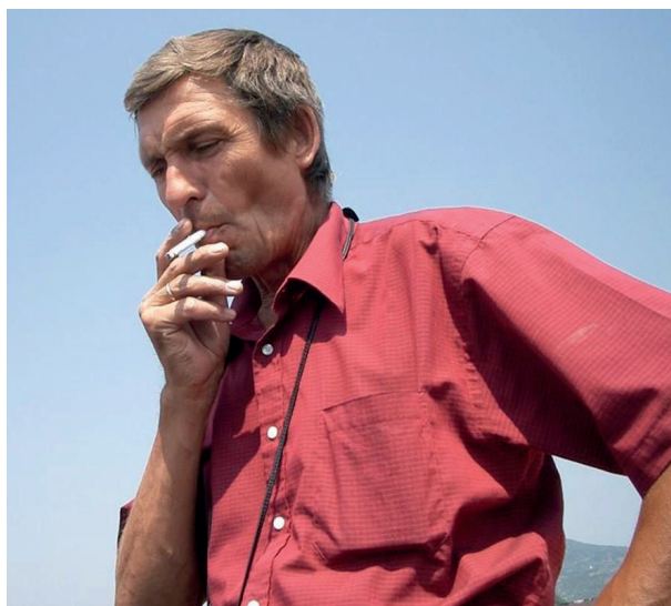
Анатолий Клян

Волошин (погиб на месте). При обстреле автобуса 29 июня смертельное ранение в живот получил оператор «Первого канала» Анатолий Клян. В конце августа официально подтвердилась информация о гибели фотокорреспондента МИА «Россия сегодня» Андрея Стенина, который почти месяц считался пропавшим без вести.