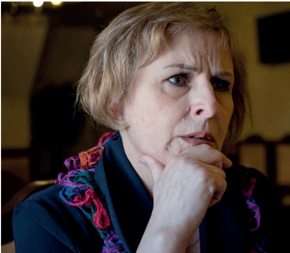
Рута Ванагайте

евреев, а их лидер Ванагас был агентом НКВД и перед расстрелом сдал советским спецслужбам своих соратников.