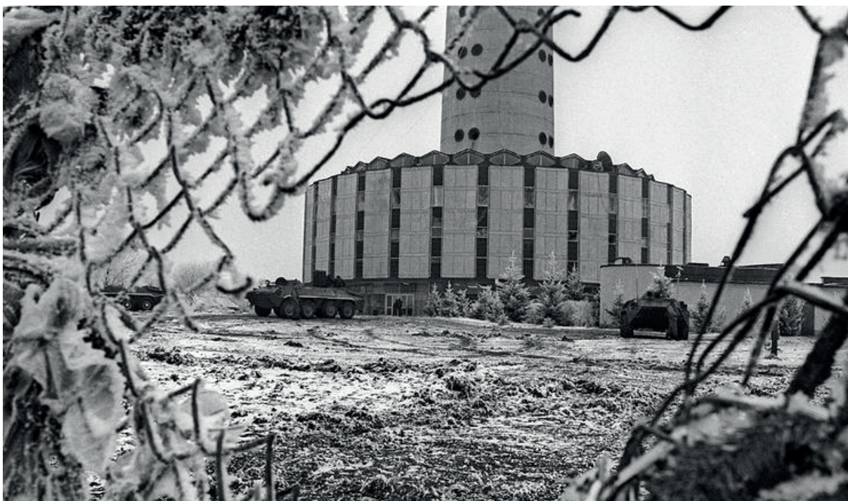
У здания телебашни в Вильнюсе, 1991 год

Через день после выхода этого репортажа Первый Балтийский канал был отключен. Позже решением литовского суда вещание ПБК было остановлено на три месяца, а программа «Человек и закон» в Литве запрещена навсегда. При этом В. Ландсбергис и другие фигуранты расследования не подавали против его авторов исков о защите чести и достоинства, не судились с ними о клевете — юридическим основанием блокировки телеканала стало законодательство 2010 года, запрещающее отрицание «преступлений оккупационных режимов».