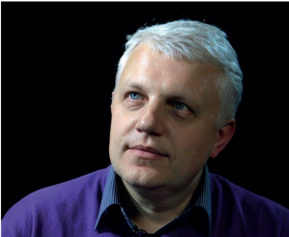
Павел Шеремет

После убийства Бузины Государственное агентство Украины по вопросам кино запретило к показу фильм «Олесь Бузина: жизнь вне времени», так как он, по мнению агентства, разжигал национальную и религиозную рознь и негативно освещал «Революцию достоинства» и украинскую национальную идею.