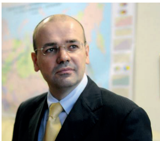
Константин Симонов

в Прибалтике выполняют функции политической полиции: преследуют оппонентов общественно-политического строя, запугивают инакомыслящих, занимаются политической цензурой в СМИ.