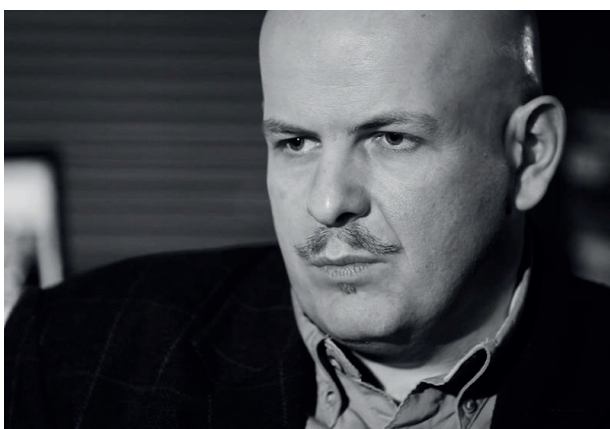
Олесь Бузина

вательным критиком украинского национализма, считал Украину, Беларусь и Россию братскими и культурно близкими народами, не поддерживал «Оранжевую революцию» и Майдан. Сам Бузина при жизни осуждал украинофобию, как и любую другую фобию, обращенную против национальностей.