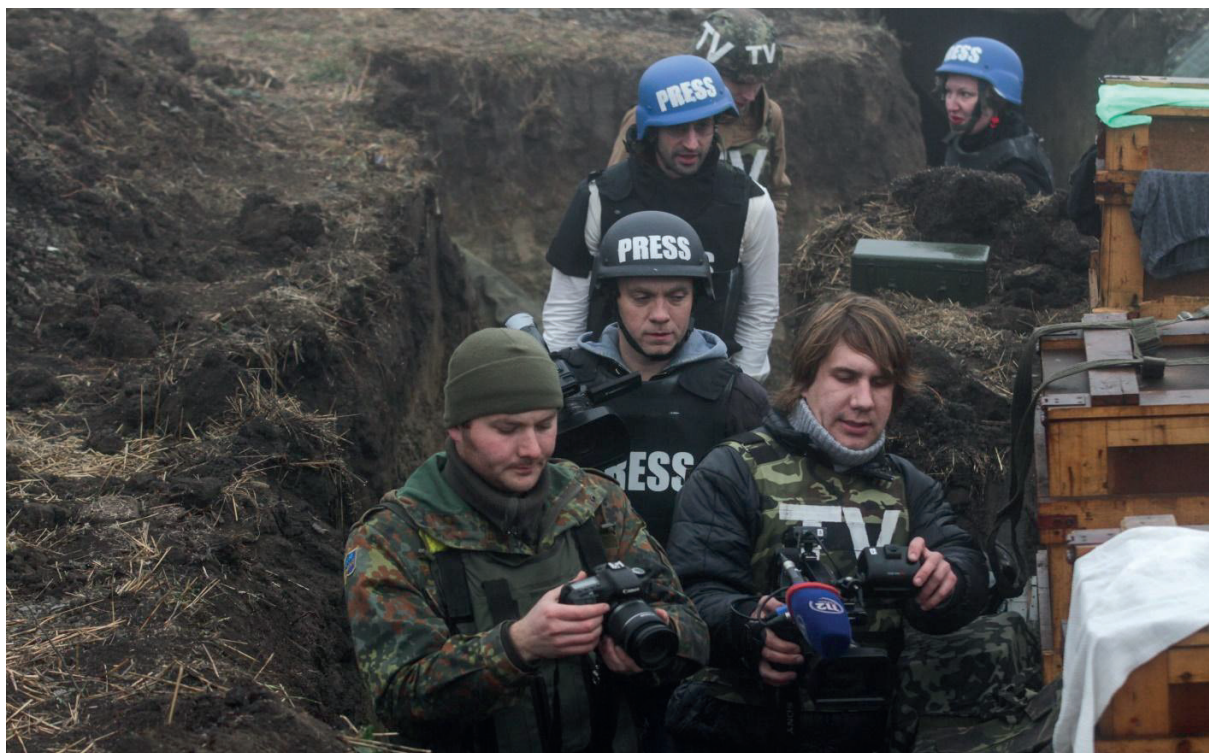
Журналисты на линии фронта в Донбассе

Таким образом, линия фронта разделила не только повстанцев и правительственные войска, но и журналистов. Сам факт работы в неудобных киевской власти и радикалам изданиях зачастую делал