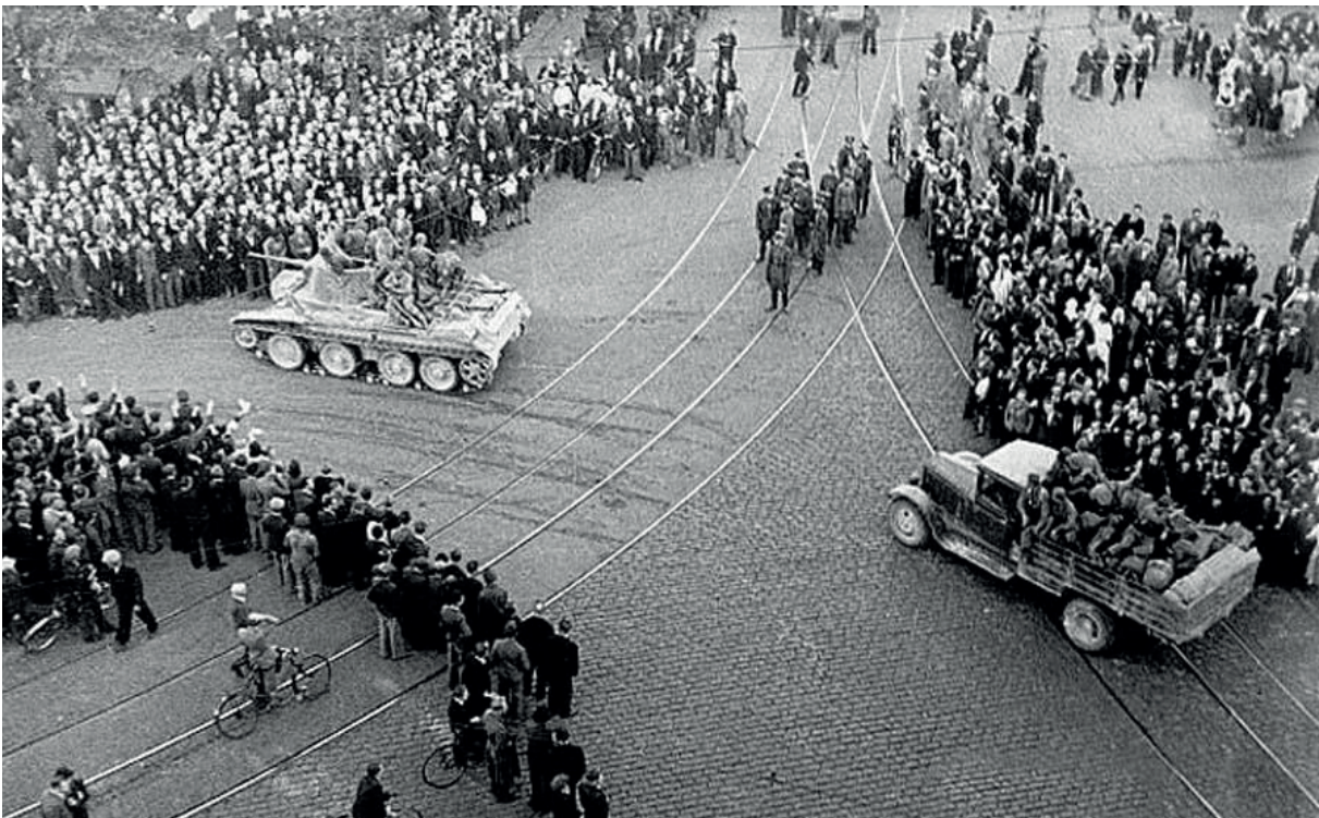
Вступление советских войск в Ригу, 1940 год

Отношение к советскому периоду истории стран Прибалтики как к «советской оккупации» стало основой национально-государственного строительства Литвы, Латвии, Эстонии после распада СССР. Оккупационная доктрина определила политическое и экономическое развитие этих стран, стала оправданием лишения граждан-