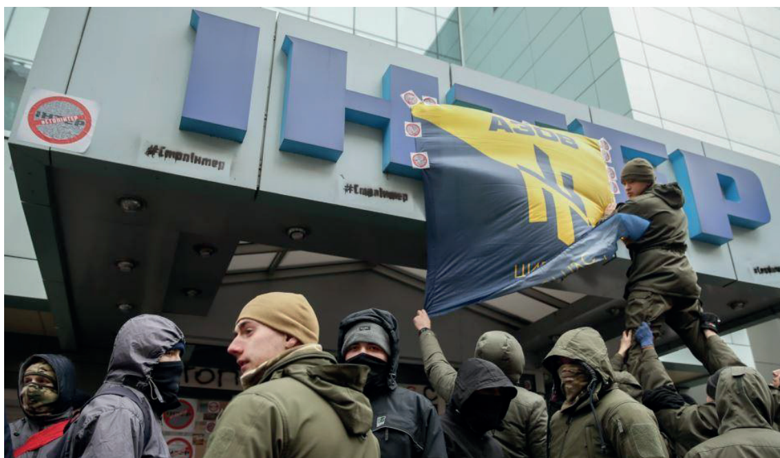
Боевики запрещенного в РФ «Азова» блокируют телеканал «Интер»

Европейского союза 31 , однако обещанного ранее закрытия сайта не произошло — после небольшой паузы в 2016 году он восстановил свою работу.