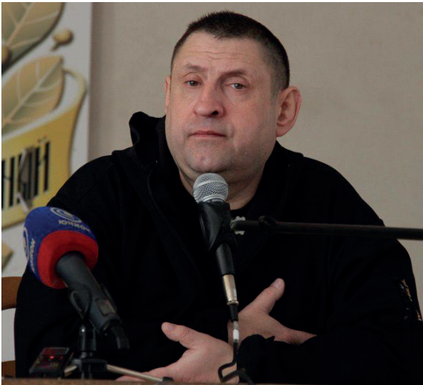
Военкор Александр Сладков