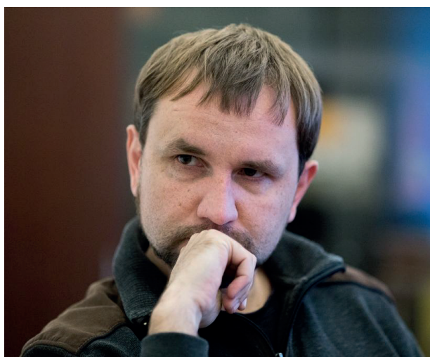
Владимир Вятрович

сервисы («Яндекс», Mail.ru, АВВУ и другие), запрещено около 140 книг российского производства, сам список постоянно пополняется. Идут разработка и обсуждение закона о запрете ввоза любых книг российских издательств из России на Украину.